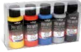
Ref. 62.103 Metallics Metalizados