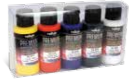
Ref. 62.104 Candy Colors Colores Transparentes