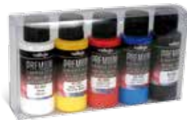
Ref. 62.101 Opaque Basics Básicos Opacos