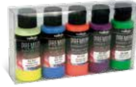
Ref. 62.102 Fluo Colors Colores Fluo